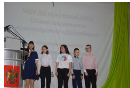
«Добродары» МБУ ДО Нукутский ДЮЦ