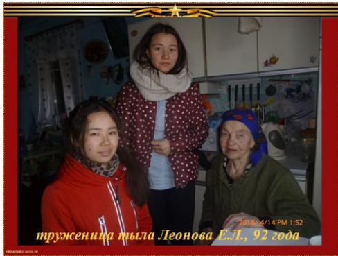
Кейс «Поколение Победителей»