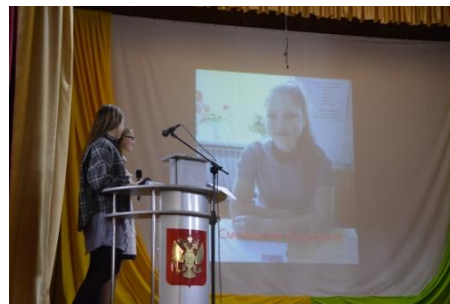
«The World» МБОУ Алтарикская СОШ