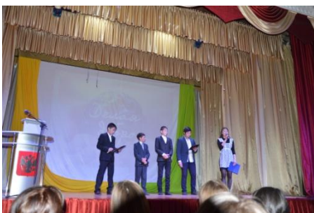
«Молодое поколение» МБОУ Нукутская СОШ