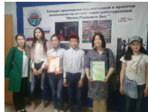
Кейс «Своя газета» МБУ «Газета Свет Октября» и МКОУ Верхне-Куйтинская ООШ