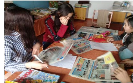
Кейс «Школьная газета»