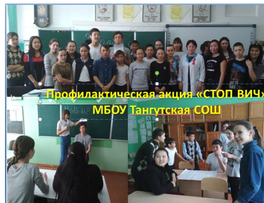
Кейс «Быть здоровым - здорово!»