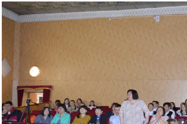
Работа экспертной комиссии.