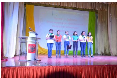
«Добрые сердца» МБОУ Целинная СОШ